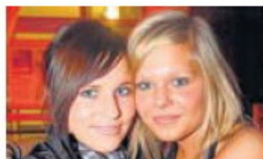
Kräftig gefeiert wird am 4. September in Grevenbroich.

Info Es sind noch Karten von der Scoop-Kartenverlosung übrig. Wer gewinnen möchte, schickt eine Mail mit Name und Adresse und dem Stichwort „Party“ an redaktion@scoop-online.de .